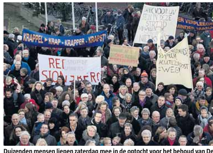
Duizenden mensen liepen zaterdag mee in de optocht voor het behoud van De Sionsberg als volwaardig ziekenhuis.

Zaterdag liepen duizenden mensen mee in de protestmars van anderhalve kilometer door